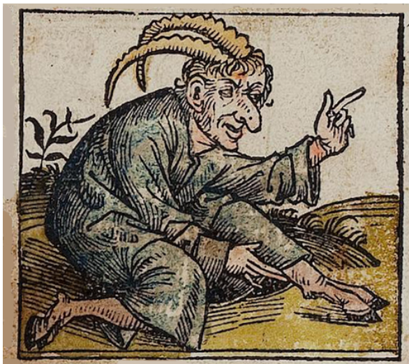
Abbildung 10: „[In Äthiopien] haben viele Hörner, lange Nasen und Ziegenfüsse, davon kannst du in der Legende des Heiligen Antonius lesen.“ (Schedel integriert hier die Dämonen, die den Heiligen Antonius in der Wüste versuchten, in die Reihe der monströsen Völker.)

Im 15. Jahrhundert nahm das Interesse an einzelnen Monstren sprunghaft zu. Dabei kam es zu einer bemerkenswerten Verlagerung. Die Monstra waren nicht mehr als Völker in fernen Ländern oder Zeiten angesiedelt, sondern wurden nun direkt als Individuen vor der eigenen Haustür, etwa in Krakau, Zürich und Florenz, geboren. Diese monströsen Geburten wurden notiert und durch die Druckerpresse verbreitet. Ein berühmtes Beispiel ist das monstrum von Ravenna. 43 Dabei handelte es sich um eine Wundergeburt, die gemäss den ersten italienischen Flugblattgedrucken 1506 in Florenz geboren worden sei und als männlich-weiblicher Zwitter mit verschiedenen tierischen Gliedern ein überaus monströses Aussehen