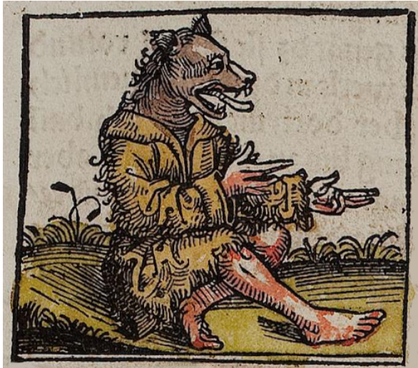
Abbildung 4: Hundsköpfige (Kynocephale): „In Indien gibt es Menschen mit Hundsköpfen, die bellend reden. Sie ernähren sich von Vogelgesang und kleiden sich mit Tierhäuten.“