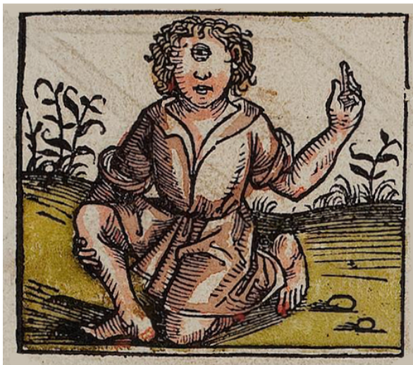
Abbildung 5: Einäugige (Zyklopen): „Etlche [in Indien] haben nur ein Auge auf der Stirn über der Nase und essen nur Tierfleisch.“