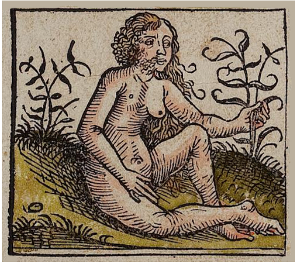
Abbildung 7: Hermaphroditen : „Viele sind [in Libyen] beiderlei Geschlechts. Die rechte Brust ist männlich, die linke ist weiblich. Sie paaren sich miteinander und bringen Nachwuchs zur Welt.“

Abbildung 6: Kopflöse/Brustköpfige (Akephali) : „In Libyen werden viele ohne Kopf geboren, haben [jedoch] Mund und Augen.“