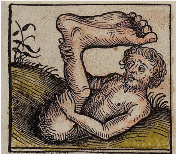
Abbildung 8: Schattenfüßler (Skiapoden) : Ohne Erläuterung bei Schedel. Die Skiapoden sind dafür bekannt, dass ihr Fuss so gross ist, dass er ihnen Schatten spendet.

Abbildung 7: Hermaphroditen : „Viele sind [in Libyen] beiderlei Geschlechts. Die rechte Brust ist männlich, die linke ist weiblich. Sie paaren sich miteinander und bringen Nachwuchs zur Welt.“