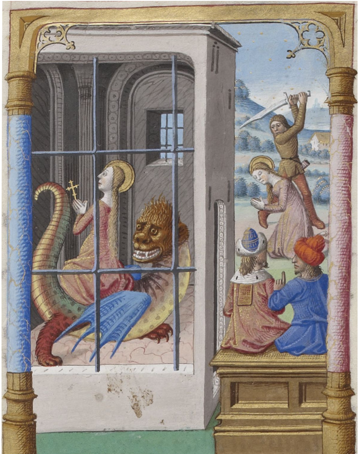
Abbildung 1: Das Martyrium der Heiligen Margarete

Die Heilige Margarete, so erzählt Jacobus de Voragine, lebte zur Zeit des Römischen Reiches in Antiochia und war von grosser Schönheit. Margarete trat gegen den Willen ihres Vaters zum Christentum über. Der römische Präfekt von Antiochia verliebte sich in das schöne Mädchen, wollte es heiraten und nahm es gefangen. Da Margarete dem christlichen Glauben