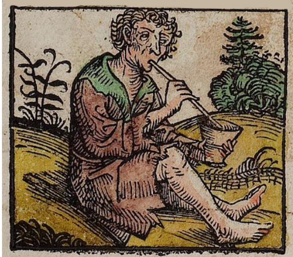
Abbildung 9: Mundlose (Astomi): „In der Nähe des Paradieses [der im äussersten Orient liegt] am Fluss Ganges gibt es Menschen, die nichts essen. Denn sie haben einen so kleinen Mund, dass sie das Getränk mit einem Halm einflössen müssen. Sie leben vom Duft der Äpfel und Blumen und sterben, sobald sie etwas Schlechtes riechen.“